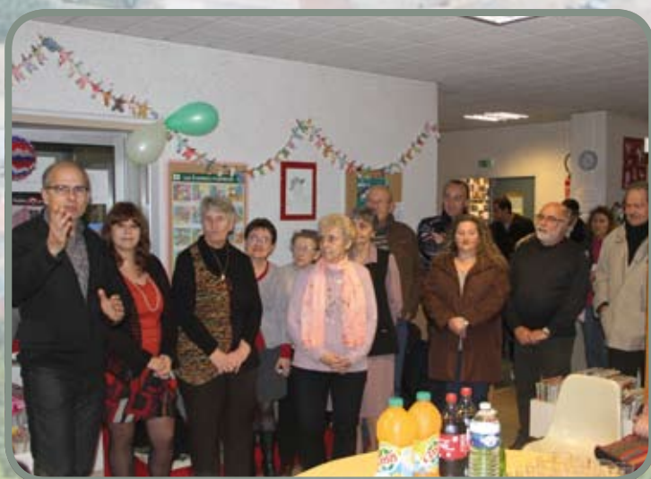
30 ans de la bibliothèque