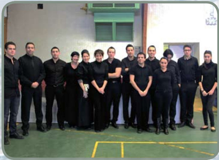
Repas des aînés, le traiteur et son équipe