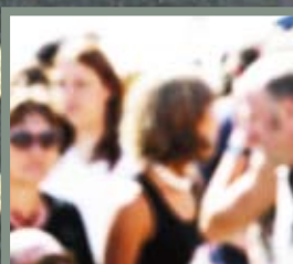
Election : nouveau mode de scrutin