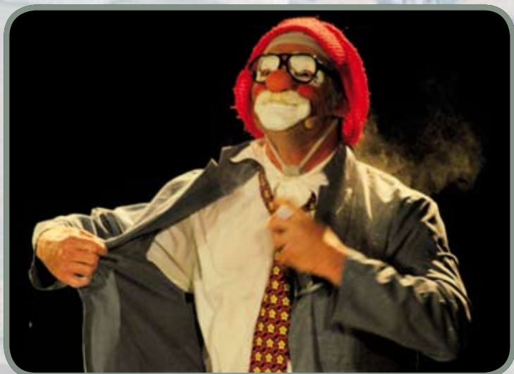
Onde day à la Bobitch