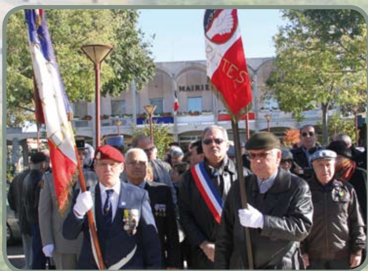
Défilé du 11 novembre