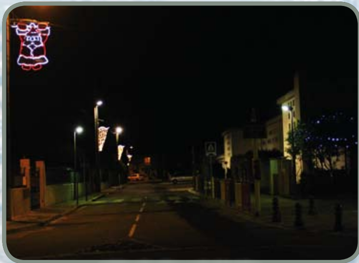
Illuminations de Noël