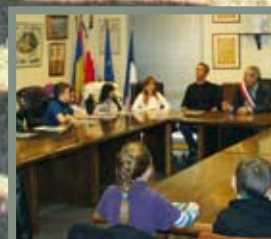
Les CM2 à la mairie