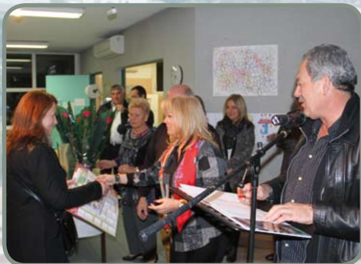
Accueil des nouveaux rodilhanais