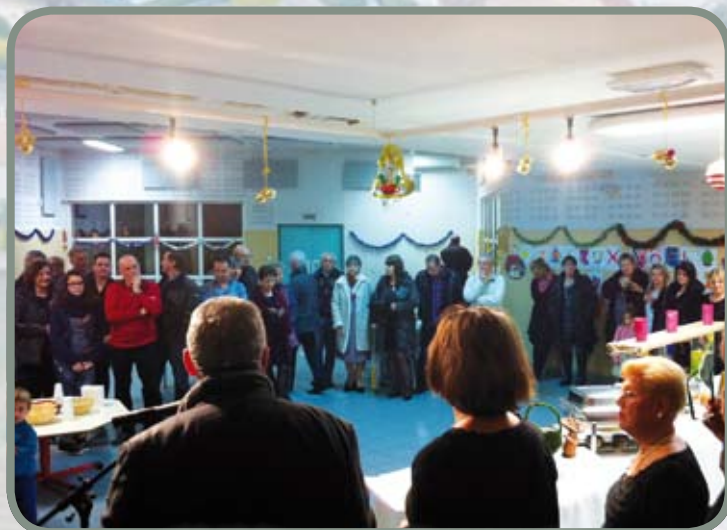
Noël du personnel communal