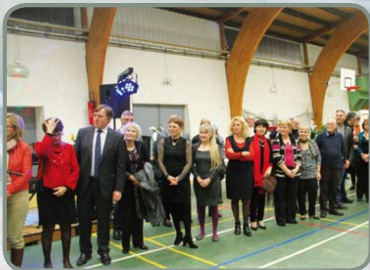
Voeux du maire : personnalités et artistes