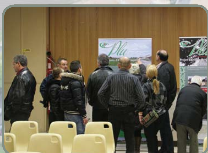
Réunion publique PLU